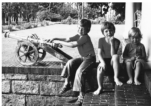
Elon și Maye Musk ( stânga sus ); Elon, Kimbal și Tosca ( stânga jos ); Elon pregătit pentru școală ( dreapta )